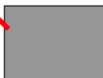
画面アスペクト比 4:3